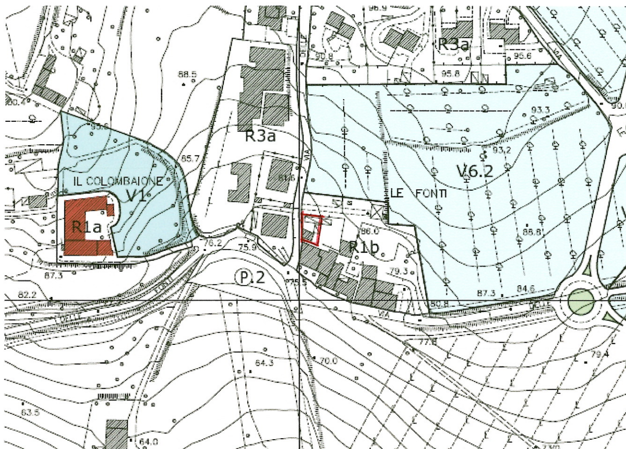
TAVOLA P 13